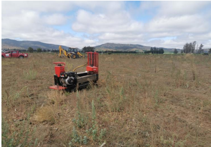
Fotografía de emplazamiento